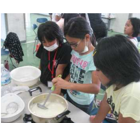
海水を入れながら煮詰めたらできあがりです