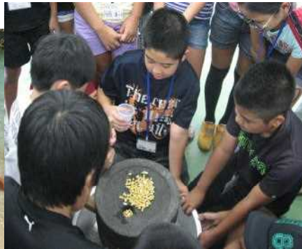
石臼で大豆を潰しています