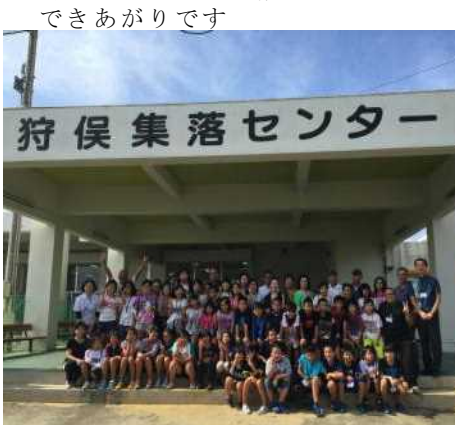
狩俣集落センター