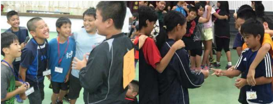
狩俣子供会 4-6年生との交流(企画、運営は全て宜小の子が行いました)