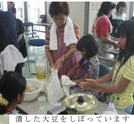
潰した大豆をしぼっています