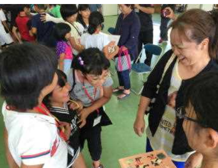
民家さんとお別れです