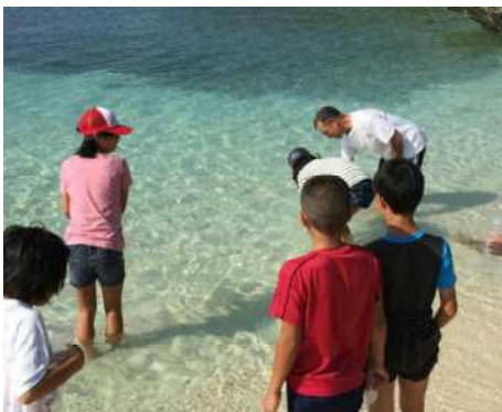
豆腐作りに必要な海水をくみます